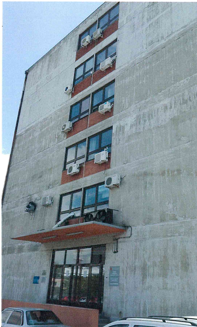
Слика 2 – детаљ фасаде објекта

Слика 1 – фасада објекта која је предмет набавке