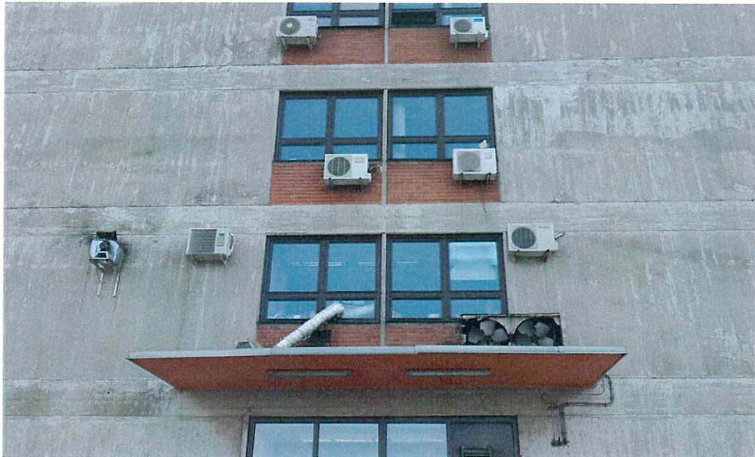
Скица 1 – фасада са новом диспозицијом клима уређаја