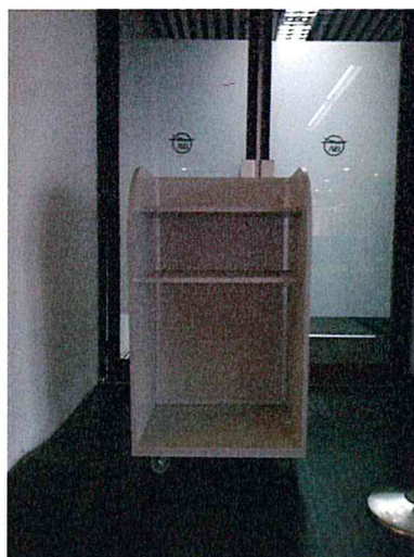
пример бр. 3