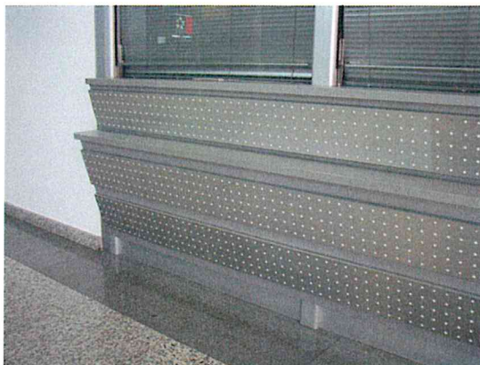
пример бр. 1