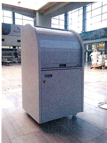
пример бр. 2