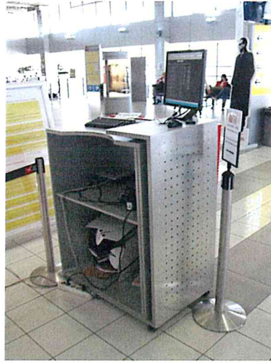
пример бр. 4